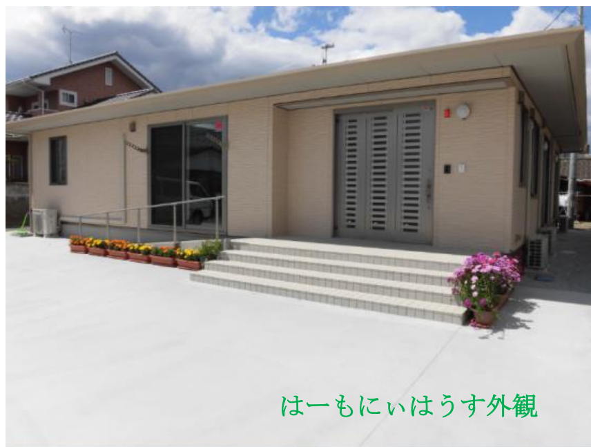
はーもにいほうす外観

最後に、みのり会会報の読者のみなさまへ。みなさまの温かい支援が当法人の元気の源です。今後とも多大なご支援をお願い申し上げます。ごあいさつと感謝のことばとさせていただきます。